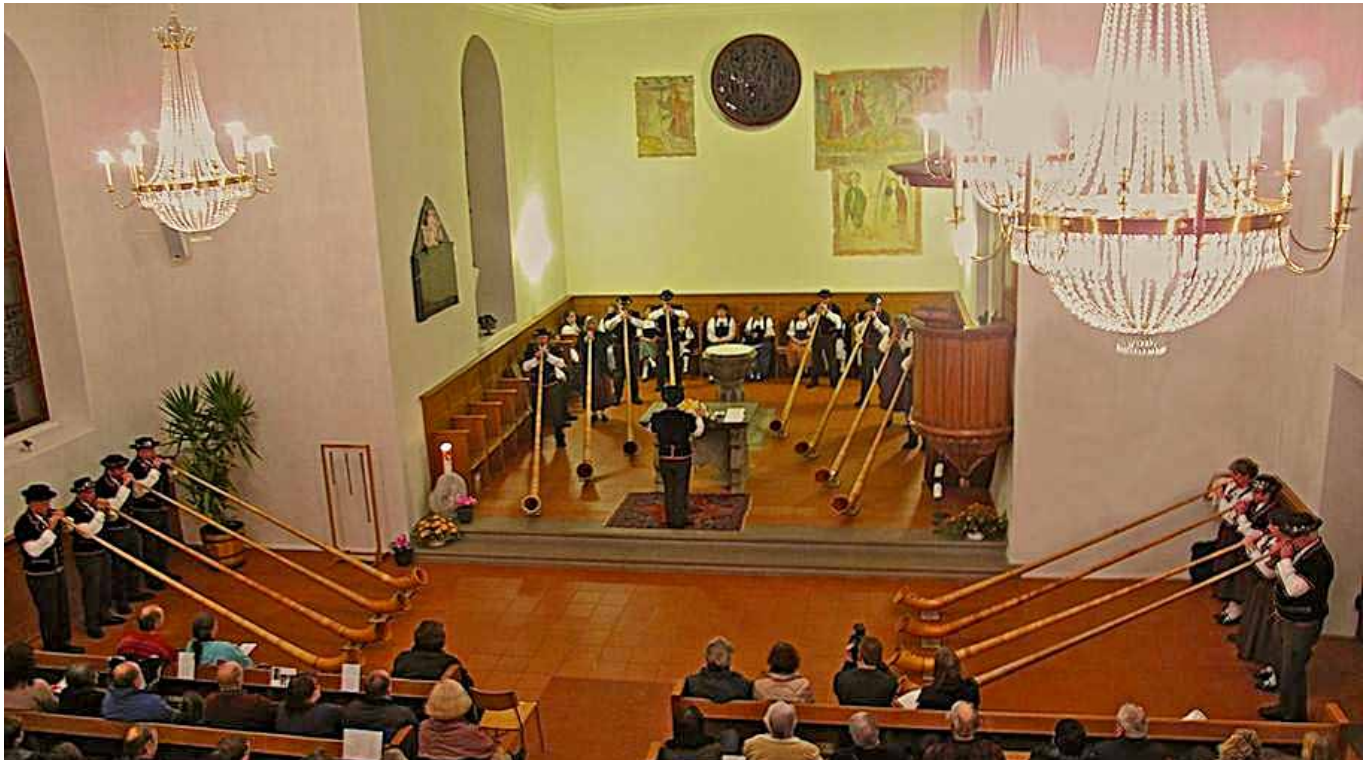
Einer der imposanten Auftritte der Gruppe in einer Kirche.