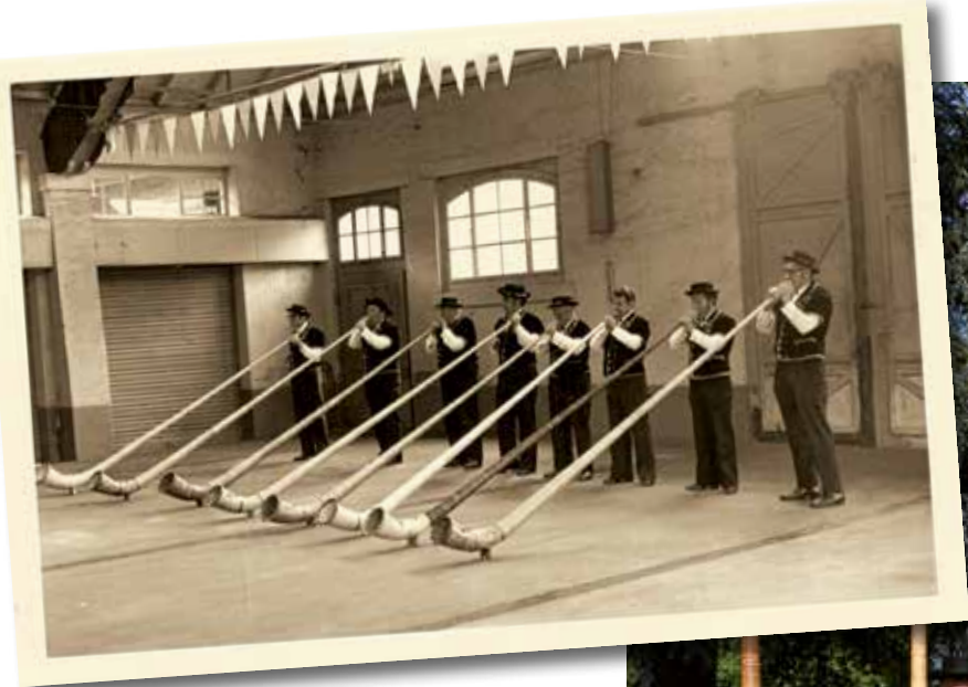
Die Alphorngruppe Oberaargau in verschiedenen Zeiten: oben ein Bild aus den Gründungsjahren, rechts das aktuelle Vereinsbild.

In den ersten Jahren hat der Verein vorwiegend in Langenthal oder Aarwangen geprobt. Seit vielen Jahren aber ist der Verein in Herzogenbuchsee akquiriert. Für die grossen Verdienste um die einheimische Kultur hat die Gemeinde Herzogenbuchsee die Gruppe 2012 mit dem