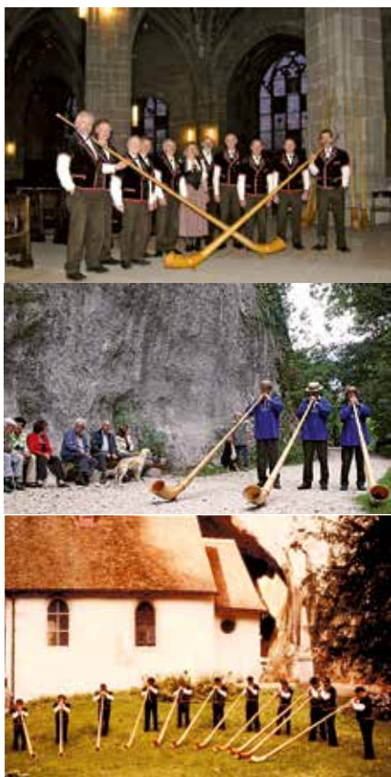
Seit vier Jahrzehnten hört man die Gruppe bei allerlei Auftritten. Hier im Berner Münster und in der Verena-Schlucht bei Solothurn.

reiste die Gruppe nach Lübeck an die Ostsee und Destinationen in Österreich, im Südtirol, im Tessin oder Familienausflüge nach Leukerbad, auf die Melchsee-